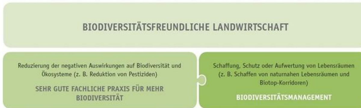
Abbildung 1 Handlungsfelder des BAP

Ein Biodiversity Action Plan sollte sich auf die beiden Hauptfelder zum Schutz der Biodiversität konzentrieren, das Biodiversitätsmanagement (Kapitel A) und die SEHR gute fachliche Praxis (Kapitel C) (Abbildung 1).